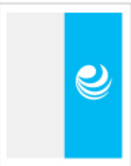
Media plana vertical