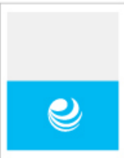
Media plana horizontal