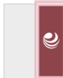
MEDIA PLANA VERTICAL